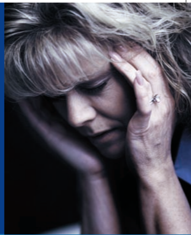
Dor de cabeça 2,6