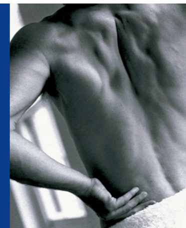
Bolovi u krstima 3,7